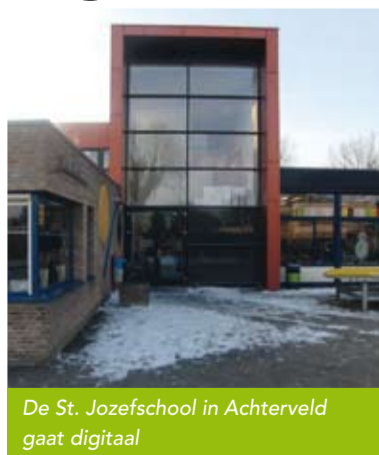
De St. Jozefschool in Achterveld gaat digitaal

ICT is vandaag de dag niet meer weg te denken uit het onderwijs. 24 uur per dag, 7 dagen in de week ligt de hele wereld voor ons open. Niet alleen voor de leerkracht, maar zeker ook bij het lesgeven aan de leerlingen in de groep, met alle voordelen van dien. Deze ontwikkeling hoort bij de wereld van nu, dus ook bij het onderwijs van nu. Administratie, leerlingvolgsysteem, uitwisseling van gegevens, digitale contacten over de hele wereld, het maken van werkstukken, tonen van illustraties, foto's en filmpjes bij de lessen, methode-gebonden programma's met directe